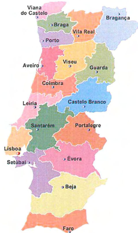
Mapa de Portugal